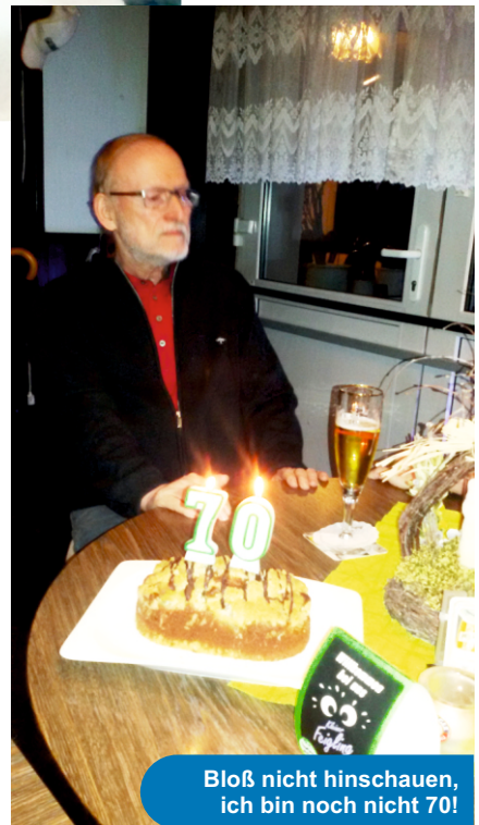
Bloß nicht hinschauen, ich bin noch nicht 70!