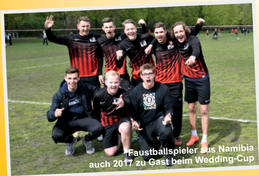
Faustballspieler aus Namibia auch 2017 zu Gast beim Wedding-Cup