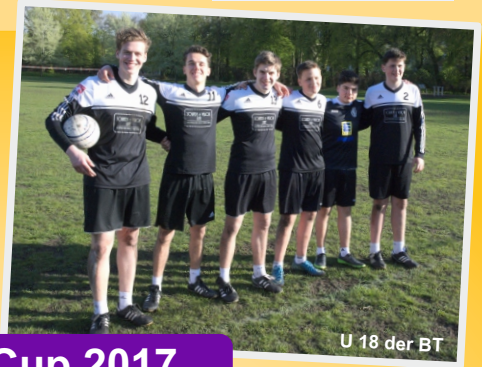
U 18 der BT