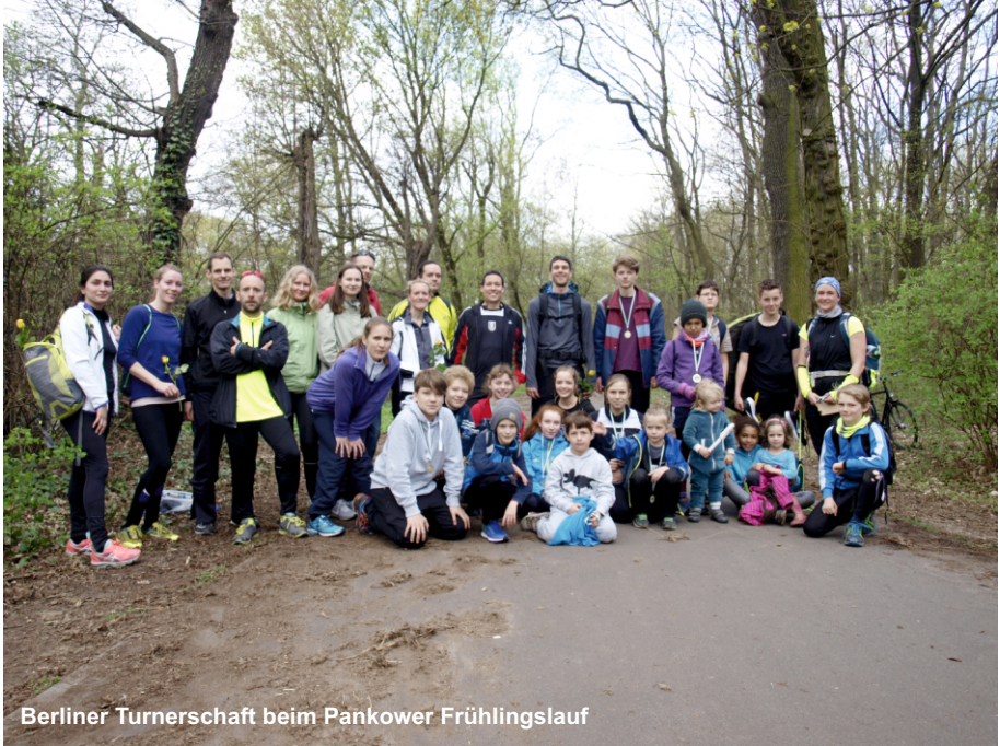
Berliner Turnerschaft beim Pankower Frühlingslauf