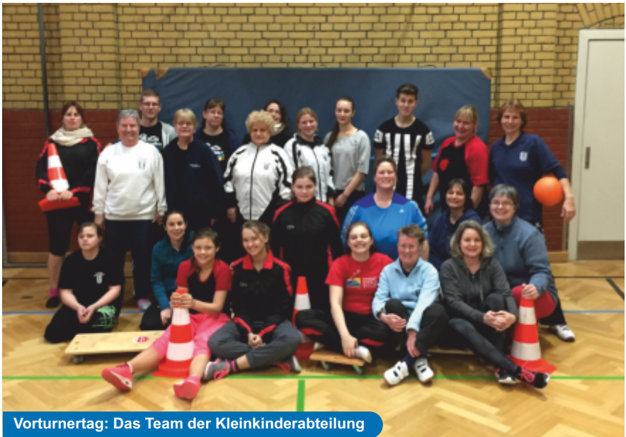
Vorturnertag: Das Team der Kleinkinderabteilung

Februar / März 2016 – www.berlinerturnerschaft.de – 131. Jhg. Nr. 2