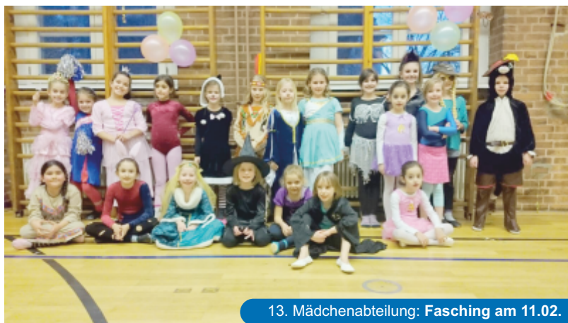
13. Mädchenabteilung: Fasching am 11.02.