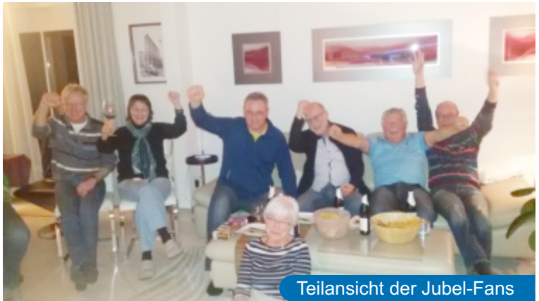
Teilansicht der Jubel-Fans