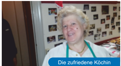
Die zufriedene Köchin