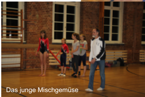
Das junge Mischgemüse