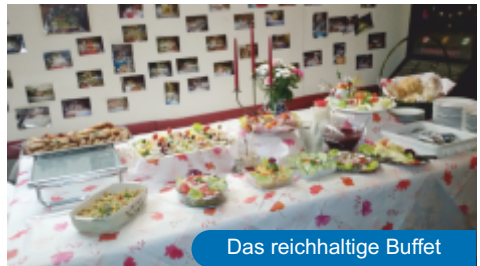
Das reichhaltige Buffet

Das reichhaltige Buffet wurde nach der üblichen bewegenden Weihnachtsrede des großen Vorsitzenden pünktlich eröffnet und somit stellte sich eine gefräßige Ruhe ein.