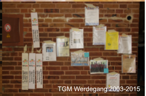
TGM Werdegang 2003-2015