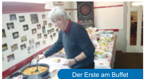
Der Erste am Buffet