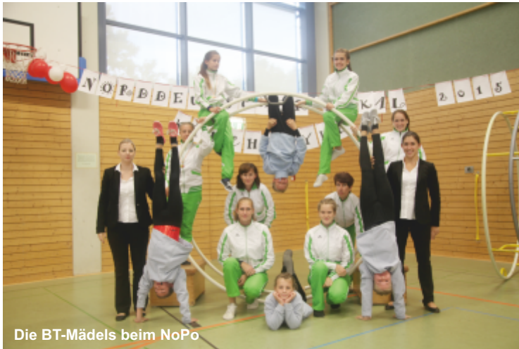
Die BT-Mädels beim NoPo