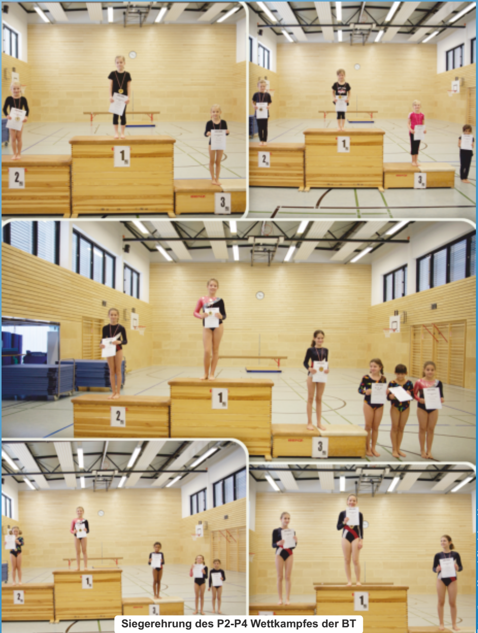
Siegerehrung des P2-P4 Wettkampfes der BT