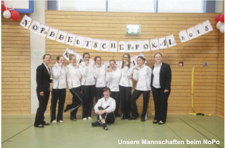
Unsere Mannschaften beim NoPo