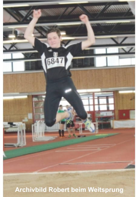
Archivbild Robert beim Weitsprung

4. Platz Anicó Kulow - W20+ (9. W20+ 16-17 Steinstoßen)