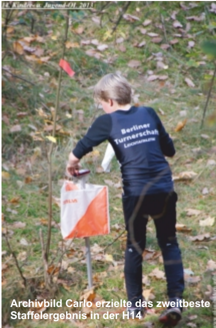
Archivbild Carlo erzielt das zweitbeste Staffelergebnis in der H14